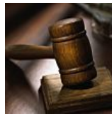
בכיר במשרד הרישוי מואשם כי קיבל שוחד מעו"ד תמורת (TheMarker)