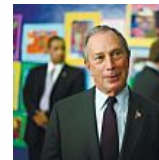
המיליארדר מייקל בלומברג: תשכחו מהשכלה אקדמית, (TheMarker)