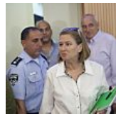
משרד המשפטים מודה: פירסמו נתונים שגויים על (TheMarker)