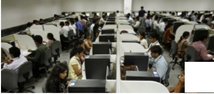
עלייתו ונפילתו של מעמד העובדים 07:31 דפנה מאור 7