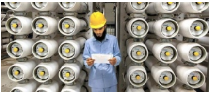
כיל רוצה לפרוץ לשוק הערבי: תמכור את הנדסת התפלה בעד מיליארד דולר 07:05 יורם גביזון

פדרמן למוסדיים: אשרו את שכרי, ואם לא יבוצע הסדר חוב בתוך חצי שנה - אשיב 50% מהכסף